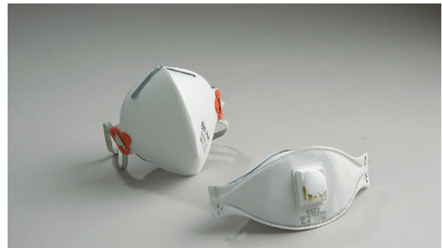
2 Partikelfiltrierende Halbmasken nach Norm EN 149

Um den angegebenen Schutz zu erreichen, müssen sie besonders sorgfältig an das Gesicht des Trägers angepasst werden.