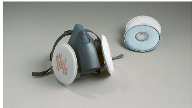
1 Halbmaske mit auswechselbaren Partikelfiltern verschiedener Filterklassen nach Norm EN 143

Die Filter sind mehrmals verwendbar und haben gegenüber Einwegmasken oft den Vorteil, dass sie einen geringeren Atemwiderstand bieten.