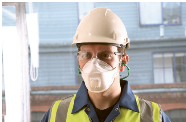
7 Faltbare Einwegmaske

Faltbare Einwegmasken sind meistens einzeln verpackt. Sie können problemlos in den Arbeitskleidern mitgeführt werden und bleiben so sauber bis zum Einsatz.