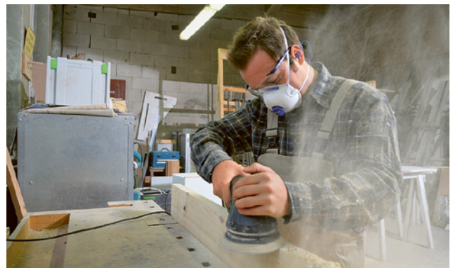
5 FFP2-Maske beim Schleifen von Holz. Bei Holzstaub von Buche oder Eiche ist immer FFP3 resp. P3 zu benutzen.