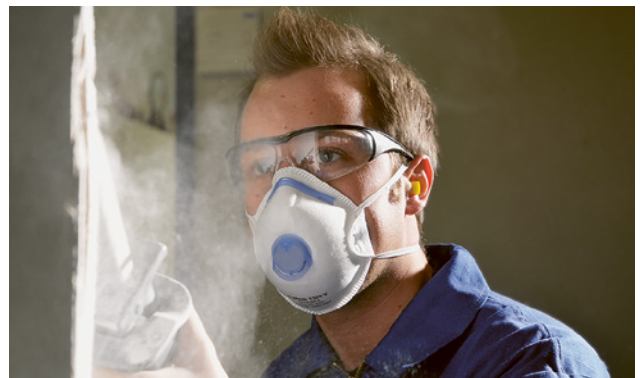
4 Masken der Filterklasse FFP2 bzw. P2 sind für viele Arbeiten der Standard.

Die meisten Arbeiten an asbesthaltigen Materialien dürfen nur von anerkannten Spezialfirmen ausgeführt werden. Weitere Informationen zu diesem Thema sind abrufbar unter: www.suva.ch/asbest