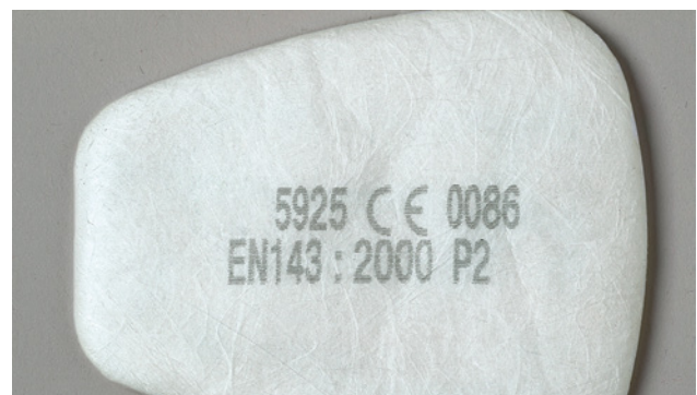
3 Filter mit CE-Zeichen und Angabe der Norm und Filterklasse

Damit der Gesundheitsschutz gewährleistet ist, dürfen nur Atemschutzmasken eingesetzt werden, die den europäischen Normen entsprechen (siehe Kapitel 5). Solche Masken erkennt man an der Kennzeichnung: Einwegmasken bzw. die auswechselbaren Filter von Halbmasken sind mit dem CE-Zeichen, der entsprechenden Norm und der Filterklasse beschriftet. Diese Angaben sind auch auf der Verpackung vorhanden.