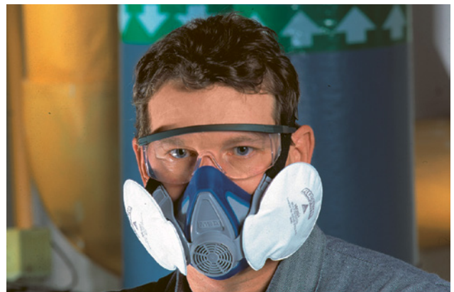
8 Halbmaske mit auswechselbaren Filtern

Aufbewahrung: Nicht in Gebrauch stehende Masken und Filter sind sauber und trocken aufzubewahren.